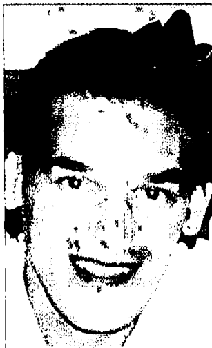
■ Il presidente Paolo Broggi

I torrazzesi hanno chiesto più spazi verdi e un'accurata manutenzione di quelli esistenti, la ripiantumazione di via Matteotti e l'ultimazione del marciapiede, l'installazione di un segnale semaforico a chiamata sulla pista ciclabile, la manutenzione del drenaggio per le acque piovane sulla strada Torrazza Cambiago, spesso impraticabile, e la sistemazione del manto stradale delle vie. Il Comitato ha puntato l'indice anche sulla scarsa informazione e sulla mancanza di regole o di applicazione di quelle esistenti: prioritari sono il rispetto dell'ordinanza sul divieto delle deiezioni dei cani in luoghi pubblici, la regolamentazione oraria dei parcheggi, le informazioni dettagliate sul Piano cave, la bonifica della di-